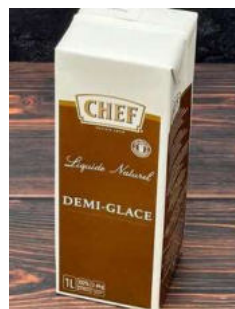
Démi Glace saus

Laat de uitjes zeer langzaam in wat boter helemaal gaar worden zonder dat ze verkleuren. Voeg de wijn en azijn toe en laat het inkoken tot 1/3 deel over is. Voeg de saus toe en laat het 10 min. zachtjes koken. Passeer de saus door een zeef.