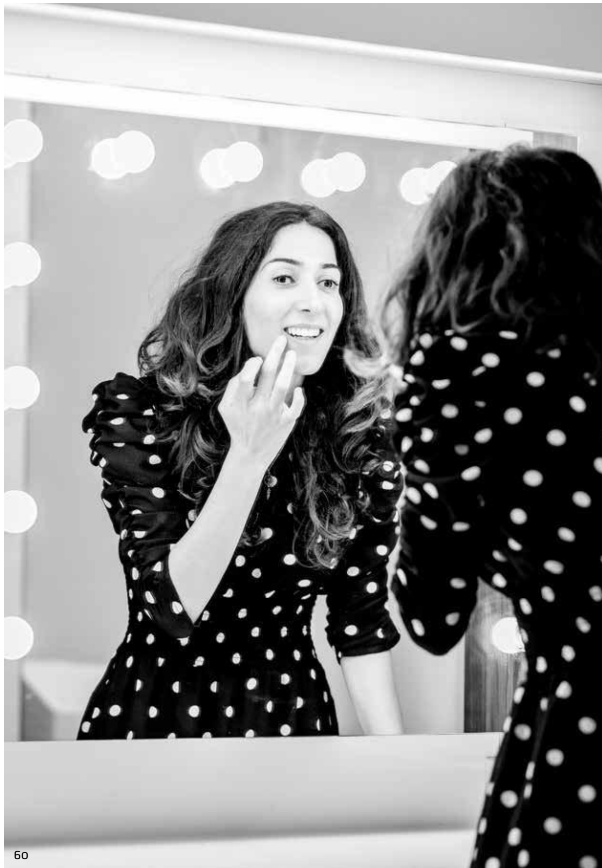
Ayşegül Karaca Actrice en theatermaker