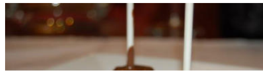
Lolly van Malibu en van Zoute Karamel